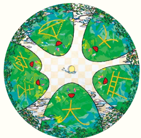
村上隆《五山送り火》2024年