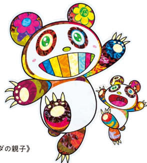
村上隆《ムラカミパンダの親子》 2024年