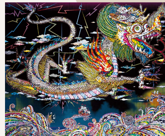
村上隆《青龍 京都》2024年