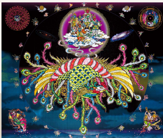
村上隆《朱雀 京都》2024年