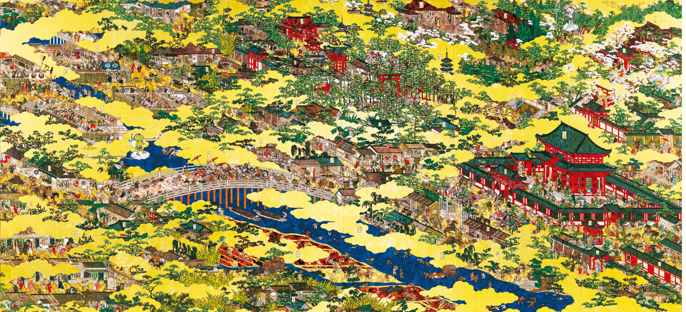
村上隆《洛中洛外図 若狭又兵衛 nip》2024年

はば 幅 13m も ある 画面 の 中 に な ん と 2700 人 も の 人 た ち や お 城 に お 寺 、 神 社 な ど 今 も 残 る 名 所 が び っ し り 描 き こ ま れ て い る よ 。 村 上 さ ん の オ リ ジ ナ ル キャ ラ ク タ ー た ち も 隠 れ て い る か ら 探 し て み て ね ！